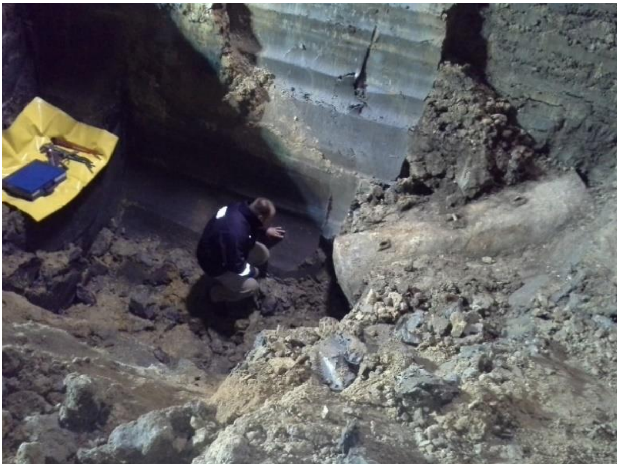
Abbildung 5: Fund einer HC 4000 bei Seelze 2014 - der gleiche Bombentyp wie in Braunsbedra.

Dieser Einsatz ist ein Beispiel der stets schnellen und unkomplizierten Hilfe bei besonderen Einsatzlagen, die sich die Bundesländer in enger Abstimmung gegenseitig leisten.