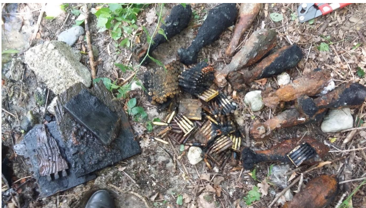
Abbildung 1: Fundmunition aus der Uferzone eines Badeteiches in Hannover.

Im Zusammenhang mit Kampfmittelfunden im Meer wird auf die Arbeit des Expertenkreises „Munition im Meer“ der Bund/Länder-Arbeitsgemeinschaft Nord- und Ostsee (BLANO) und dessen jährliche Berichterstattung hingewiesen. Nähere Informationen und eine ausführliche Berichterstattung zur Munitionsbelastung in Nord- und Ostsee kann im Internet unter dem nachstehenden Link abgerufen werden: