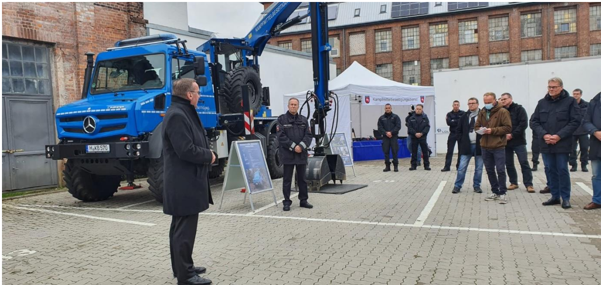
Abbildung 2: Leitertagung der Kampfmittelräumenden.

Mit Referenten und Fachexpertise unterstützte der KBD auch bei externen Aus- und Fortbildungsveranstaltungen, wie zum Beispiel: