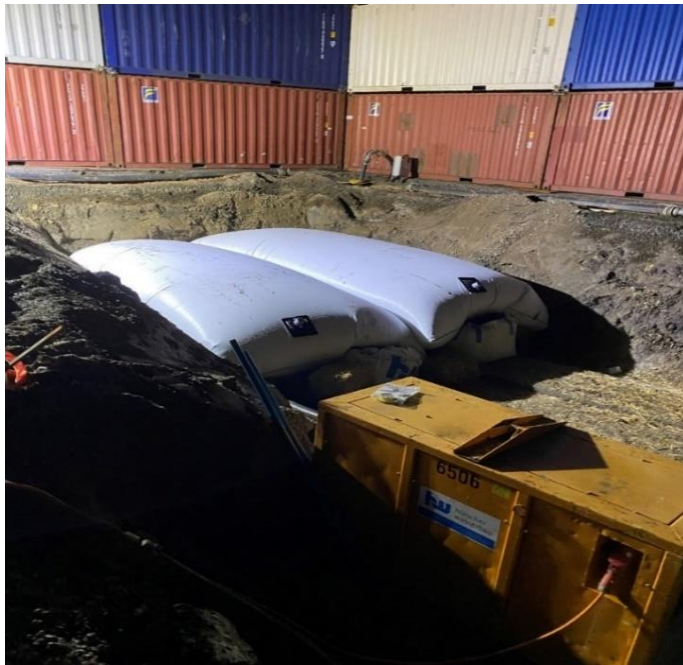
Abbildung 3: Eine mit Container eingehauste und zur Sprengung vorbereitete Fundstelle.

Bereits der erste (Groß-)Einsatz Ende Januar in Göttingen stellte eine besondere Belastung für die Mitarbeitenden des KBD dar. In einer ausgedehnten Aktion wurden in der Nacht vom 30. auf den 31.01.2021 vier amerikanische 1000 lbs SAP Fliegerbomben mit Langzeitzündern kontrolliert gesprengt.