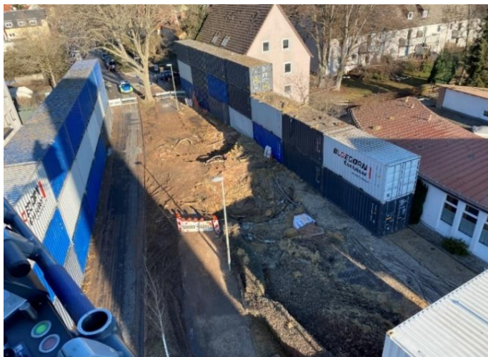
Abbildung 4: Ein Blick von Oben auf zwei der Sprengstellen - erste Aufräumarbeiten hatten bereits stattgefunden.

Die Blindgänger wurden bei Sondierungsarbeiten gefunden, nachdem Luftbildauswertende des KBD im Oktober 2020 mehrere verdächtige Punkte auf den Kriegsluftbildern erkannt hatten. Daher konnte der Einsatz inmitten der Corona-Pandemie gründlich vorbereitet werden. Insgesamt mussten rund 8.500 Anwohnerinnen und Anwohner ihre Wohnungen verlassen.