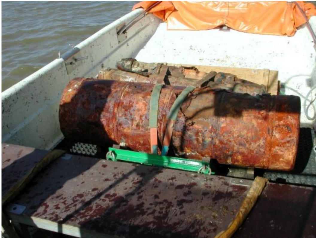
Abb. 10: Geborgene Kampfmittel aus dem niedersächsischen Wattenmeer

trockengefallenen Sandbänken durchgeführt. Für zusätzliche Vergrämungsmaßnahmen der Meeressäuger hat das Land Niedersachsen in Abstimmung mit den Umweltverbänden einen Seehundvergrämer (Seal Scarer) angeschafft, der seit 2014 erfolgreich zum Einsatz kommt.