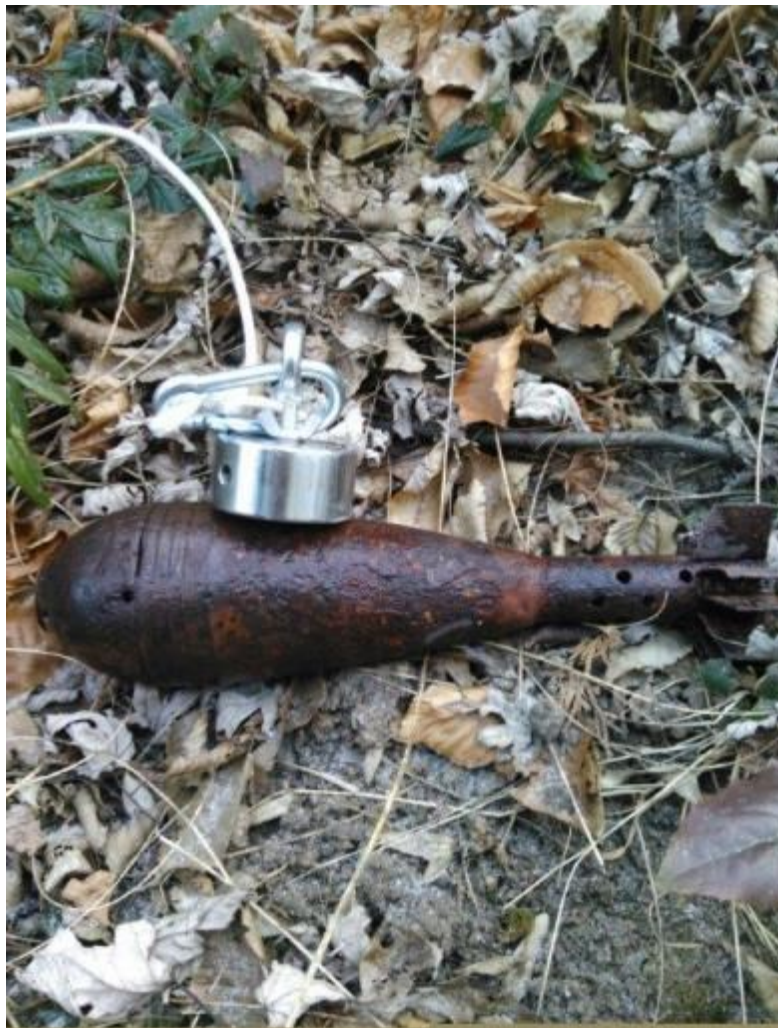
Abb. 1: Magnetangel mit einer 8 cm Wurfgranate

Besonders gefährdet sind immer wieder Kinder, Sammler von Militaria, „Schatzsucher“, in Land- und Forstbetrieben Tätige, Tiefbaupersonal und Angehörige von Metallrecyclingfirmen. In den letzten Jahren ist darüber hinaus aufgefallen, dass sich die Munitionsfunde durch „Schatzsucher“ und „Geocacher“, welche u. a. auf ehemaligen Sprengplätzen und Munitionsanstalten mit Hilfe von GPS-Geräten und Sonden vermehrt unterwegs sind, erhöht haben. Der neueste Trend ist das „Magnetangeln“ in Flüssen, wobei ein Magnet an einem Seil im Bereich von Brücken in das Flussbett gelassen wird, um Gegenstände, die in das Wasser geworfen wurden, wie auch zum Kriegsende „Munition“, wieder herauszufischen.