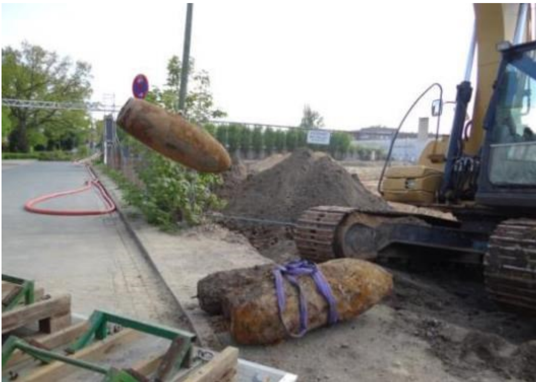
Abb. 3: Bergung von zwei 500lbs Bomben und einer 1000lbs Bombe