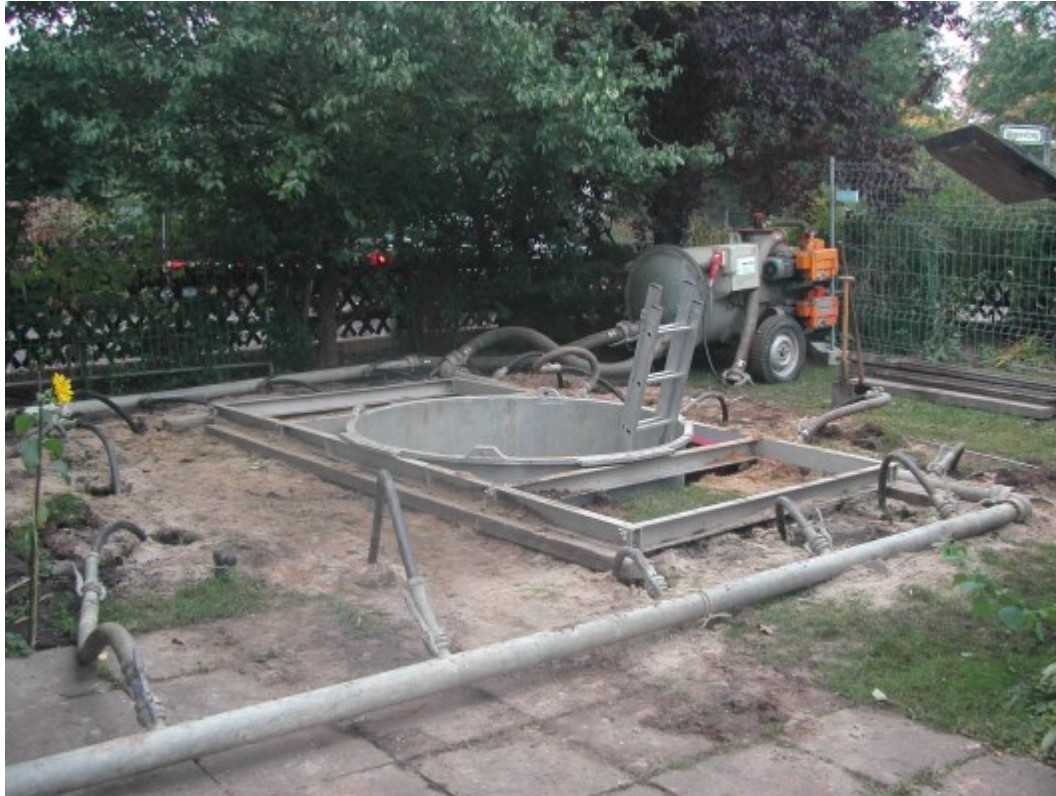
Abb. 4: Baugrubensicherung durch Schachtringe und Grundwasserabsenkung