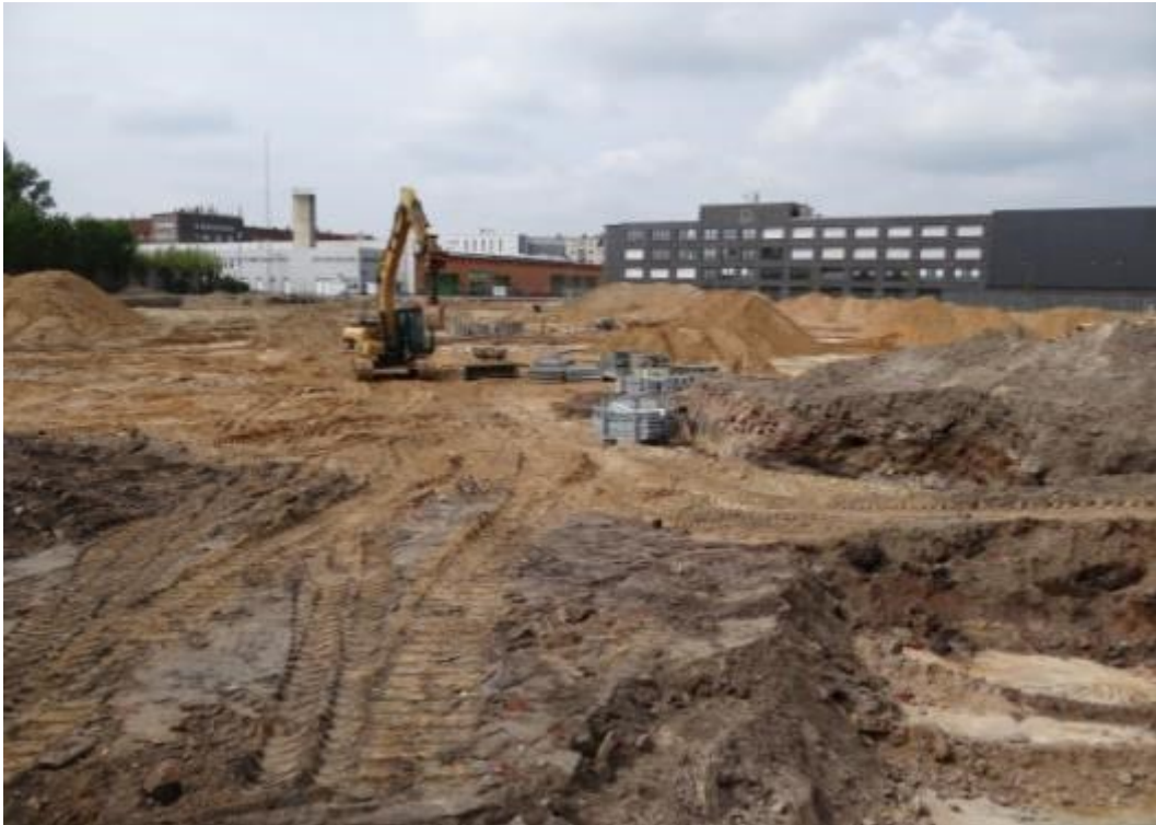
Abb. 2: Großbaustelle in Hannover, wo am 07.05.2017 drei Bombenblindgänger geborgen wurden.

der vergangenen Jahre und das Erfordernis für jede gewerbliche Tätigkeit eine Gefährdungsbeurteilung zu erstellen zu diesem Umdenken beigetragen.