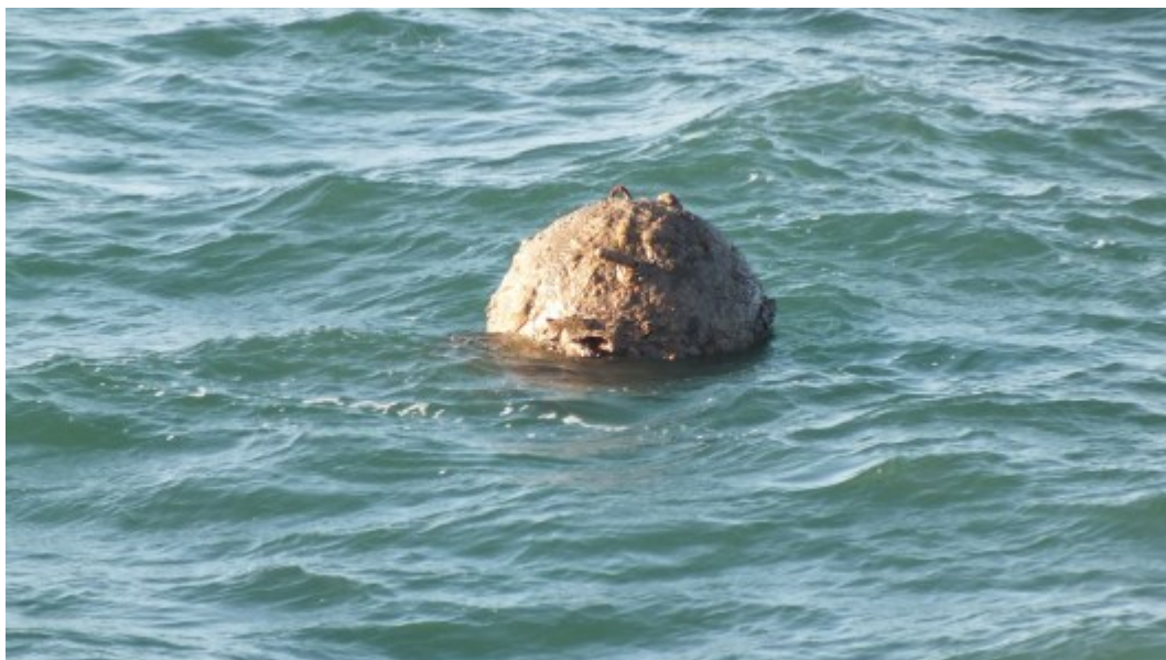
Abb. 9: Treibende Ankertaumine in der Nordsee