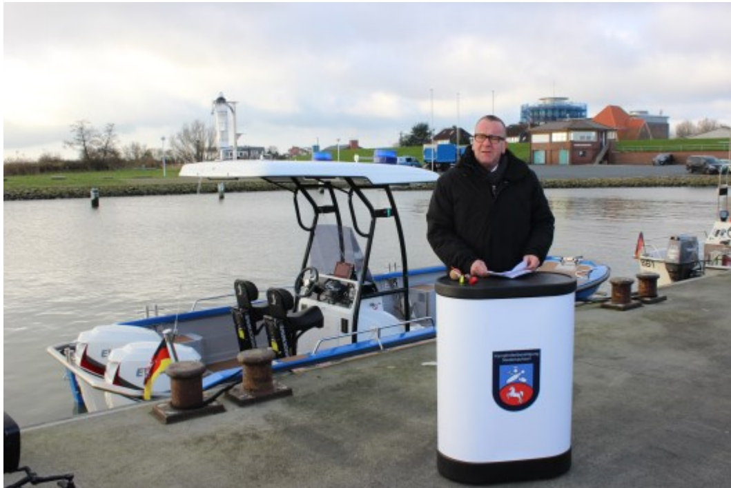
Abb. 12: Niedersachsens Innenminister Boris Pistorius bei der Bootsübergabe