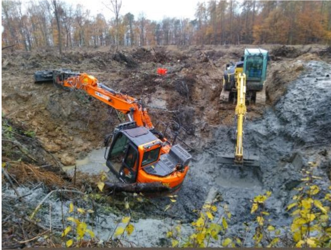
Abb. 11: RST Lengler II - Trichterräumung