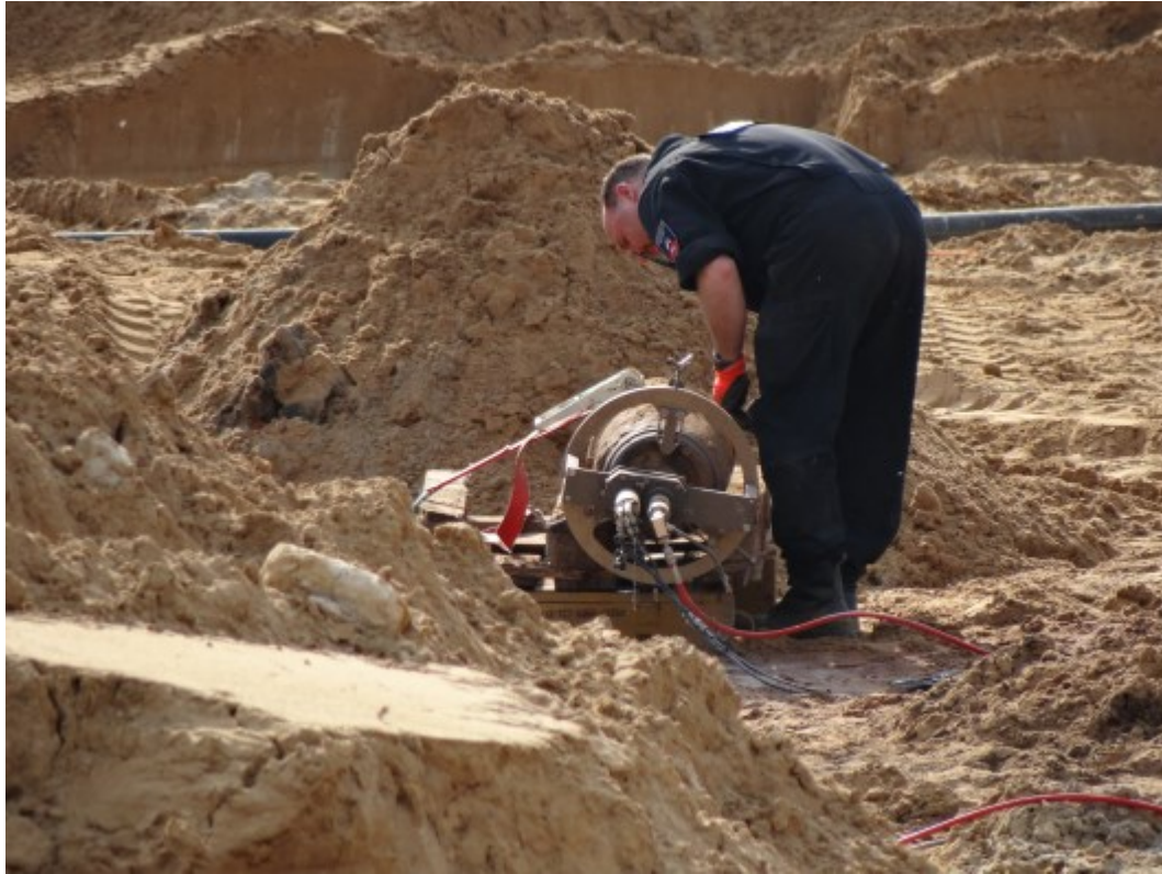
Abb. 7: Vorbereitung auf den Einsatz der Wasserstrahlschneidanlage