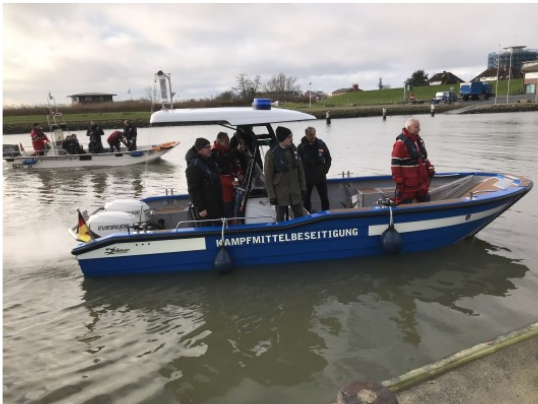
Abb. 13: Probefahrt am 01.12.2017 in Wilhelmshaven