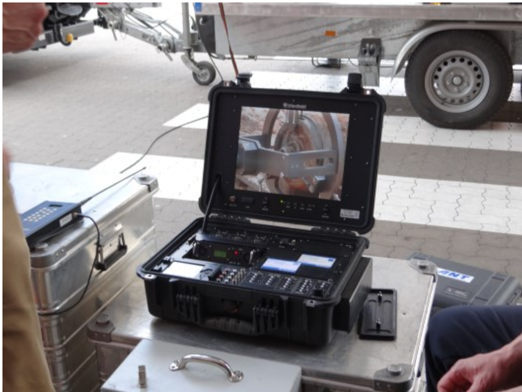
Abb. 8: Steuerung und Überwachung der Wasserstrahlschneidanlage